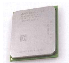
AMD Athlon64 3000+