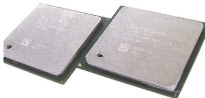
Intel Pentium 4 3,4GHz

На слици 1. приказана је матична плоча Micro-Star MS6119 ver1.1 BX2, ATX формата са SLOT 1 подножјем за Intel-ове процесоре, BX2 чипсетом, 3 ISA, 4 PCI и AGP слотом и 3168-пинских (пинови=иглице=проводници) DIMM подножја за SDRAM меморију.