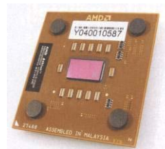
AMD Athlon 3200+